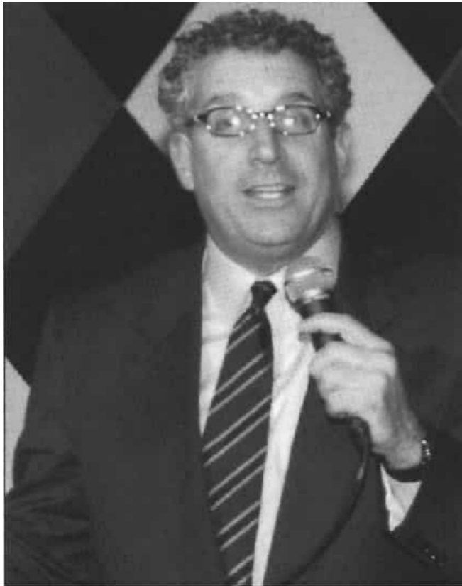
Đào Tiểu Vũ eBook