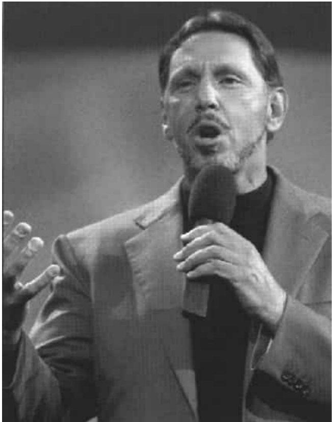
Đào Tiêu Vũ eBook