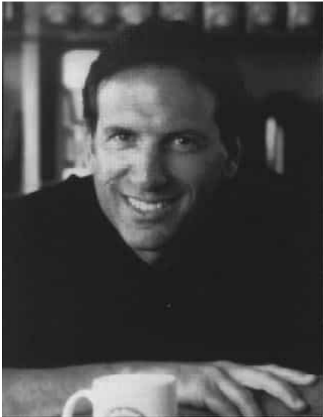
Đào Tiểu Vũ eBook