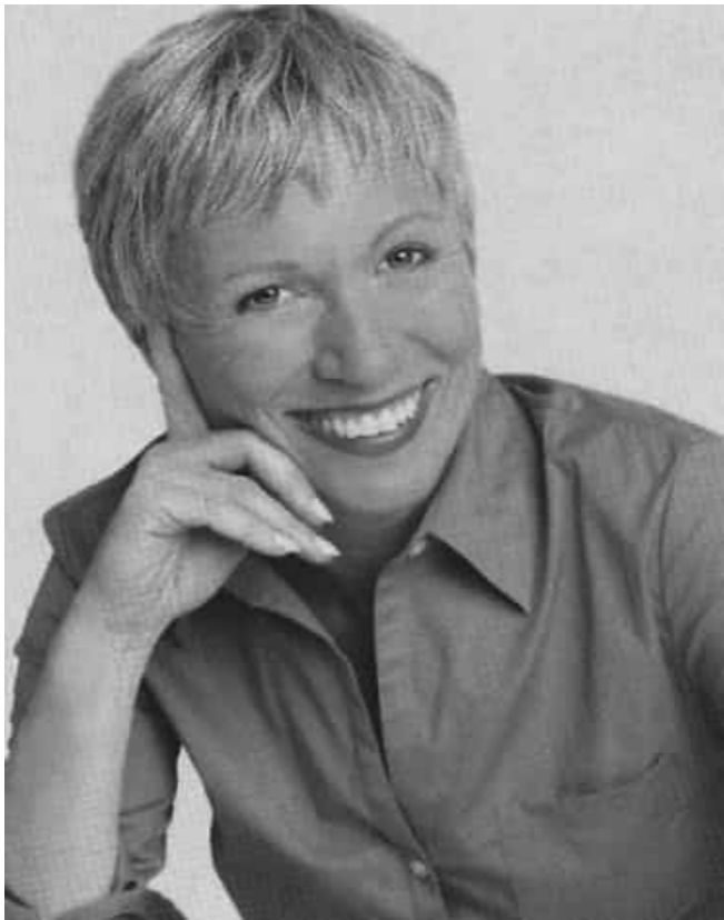
Đào Tiểu Vũ eBook