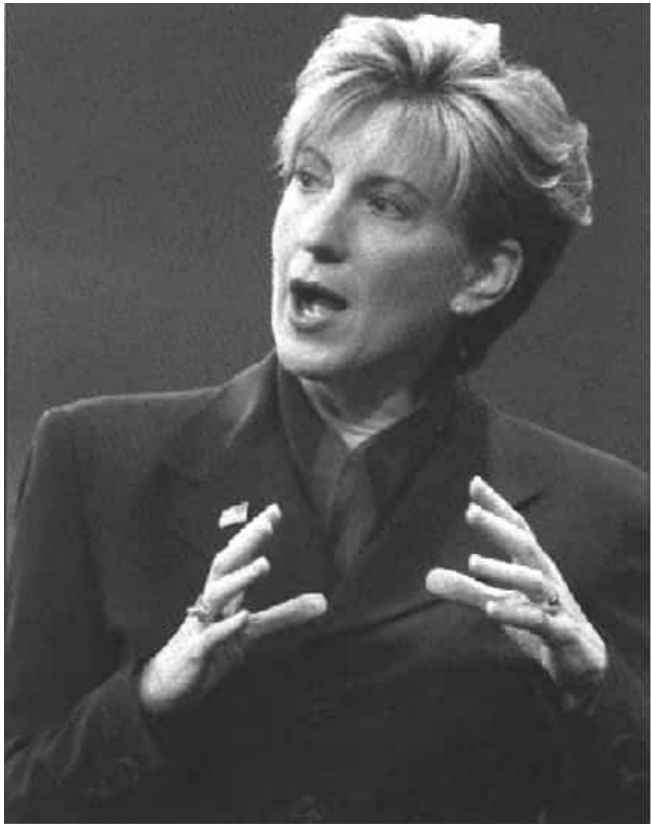
Đào Tiểu Vũ eBook