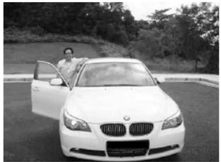
Tôi và chiếc xe BMW 523i của mình

Tôi biết tôi có vẻ giống như một nhà tiếp thị Internet điển hình đang phô trương tại đây. Mặc dù vậy, vào ngày mua được chiếc BMW này tôi thực sự hạnh phúc bởi vì nó tượng trưng cho kết quả nhiều năm làm việc chăm chỉ và khó nhọc. Tôi muốn có thứ gì đó gợi nhắc về việc tôi đã đi xa như thế nào và nhắc nhở tôi về hành trình đi đến thành công mỗi lần tôi ngồi sau tay lái.