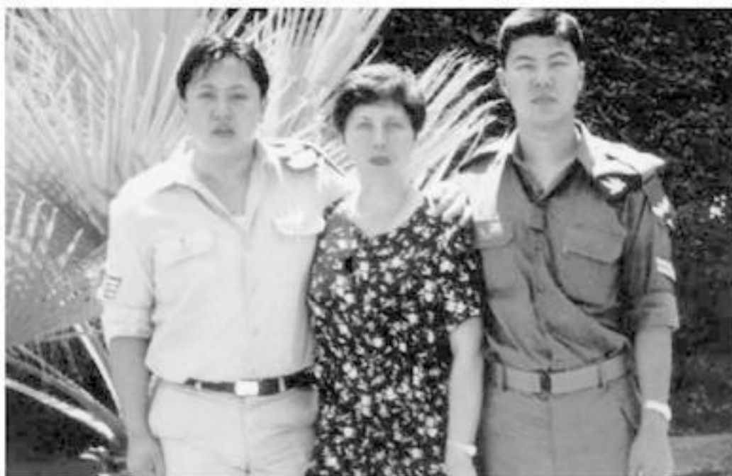
Ba mẹ con đi bộ cùng nhau.